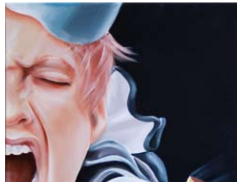
(c) by B. Wasserthal-Zuccari - Technischer Plan, Foto Harbour Brigge, Bildwerk Harlekino