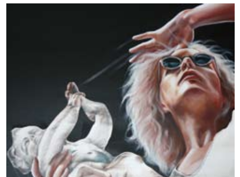
Berenike Wasserthal-Zuccari Werkausschnitt in Acryl & Farbstift auf Leinwand